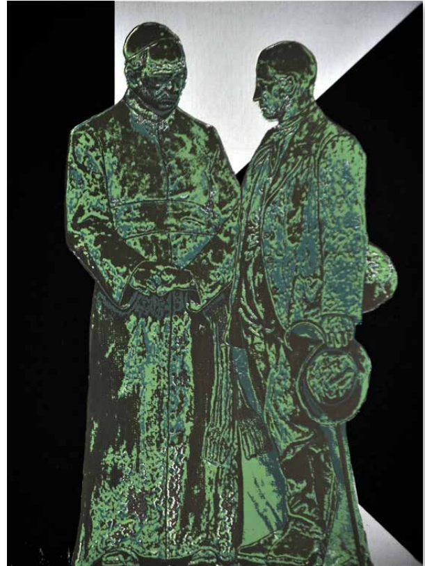
alle Abb. Serigraphien: slomigrafik